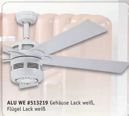
ALU WE #513219 Gehäuse Lack weiß, Flügel Lack weiß