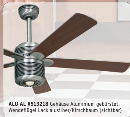
ALU AL #513218 Gehäuse Aluminium gebürstet, Wendeflügel Lack alusilber/Kirschbaum (sichtbar)