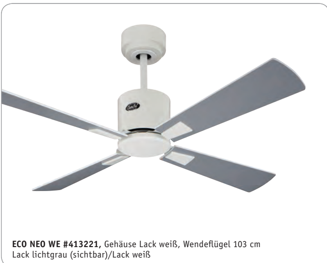
ECO NEO WE #413221 , Gehäuse Lack weiß, Wende- flügel 103 cm Lack lichtgrau (sichtbar)/Lack weiß