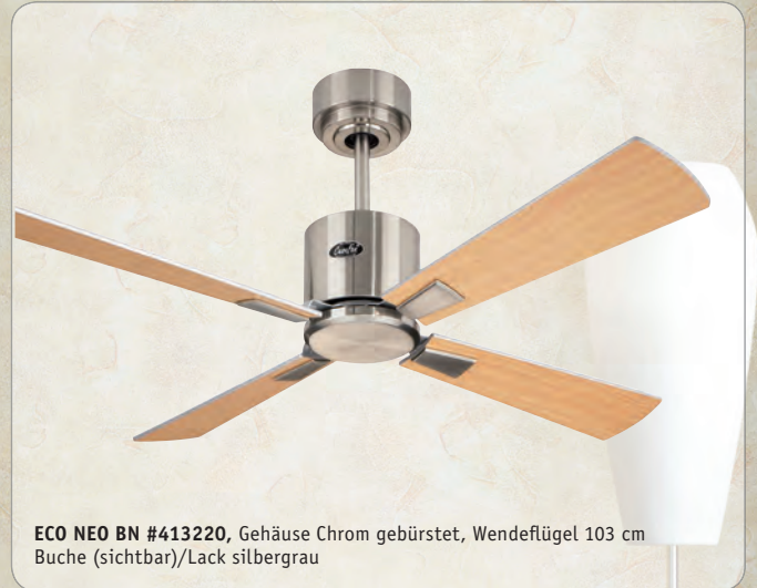
ECO NEO BN #413220 , Gehäuse Chrom gebürstet, Wende- flügel 103 cm Buche (sichtbar)/Lack silbergrau