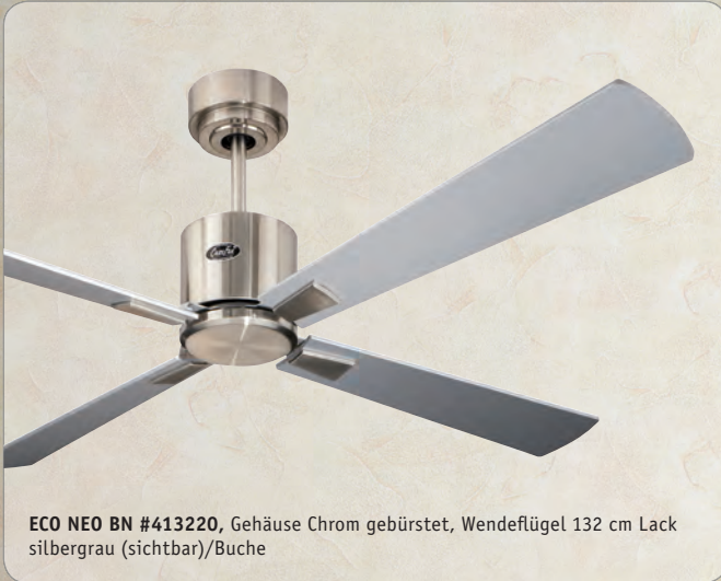
ECO NEO BN #413220 , Gehäuse Chrom gebürstet, Wende- flügel 132 cm Lack silbergrau (sichtbar)/Buche