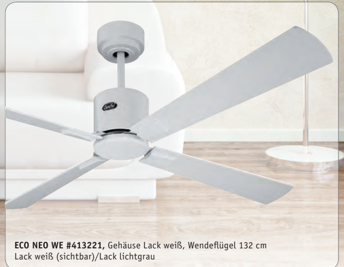
ECO NEO WE #413221 , Gehäuse Lack weiß, Wende- flügel 132 cm Lack weiß (sichtbar)/Lack lichtgrau