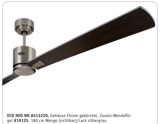
ECO NEO BN #413220 , Gehäuse Chrom gebürstet, Zusatz-Wende- flügel #19125, 180 cm Wenge (sichtbar)/Lack silbergrau