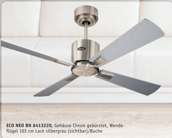
ECO NEO BN #413220 , Gehäuse Chrom gebürstet, Wende- flügel 103 cm Lack silbergrau (sichtbar)/Buche