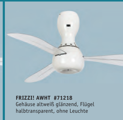
FRIZZI! AWHT #71218 Gehäuse altweiß glänzend, Flügel halbtransparent, ohne Leuchte