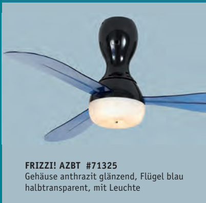
FRIZZI! AZBT #71325 Gehäuse anthrazit glänzend, Flügel blau halbtransparent, mit Leuchte