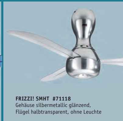
FRIZZI! SMHT #71118 Gehäuse silbermetallisch glänzend, Flügel halbtransparent, ohne Leuchte