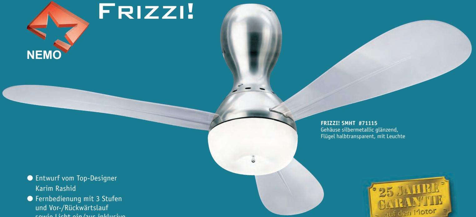
FRIZZI! SMHT #71115 Gehäuse silbermetallisch glänzend, Flügel halbtransparent, mit Leuchte