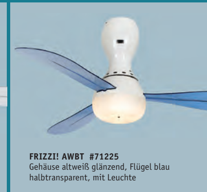
FRIZZI! AWBT #71225 Gehäuse altweiß glänzend, Flügel blau halbtransparent, mit Leuchte