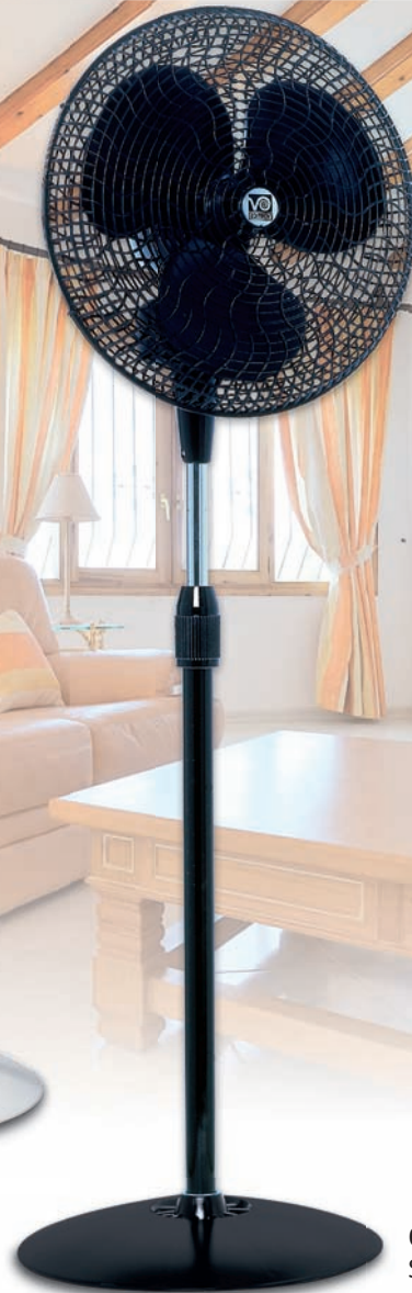
GORDON C 40 SW #60621 Standventilator schwarz