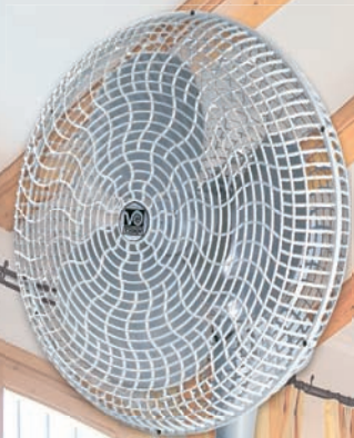
GORDON C 40 LG #60620 Standventilator lichtgrau

● aktuelles italienisches Design, aufgenommen in den ADI DESIGN INDEX 2004