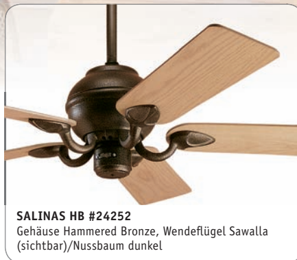
SALINAS HB #24252 Gehäuse Hammered Bronze, Wendeblätter Sawalla (sichtbar)/Nussbaum dunkel