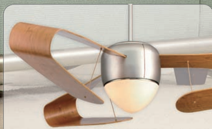
THE CENTAURUS SN #FP4220SN mit Flügel #BB4220CY, Kirschbaum gebogen (Ø 152 cm)