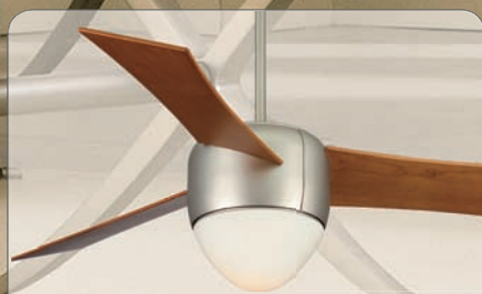
THE CENTAURUS SN #FP4220SN mit Flügel #SB4220CY, Kirschbaum gerade (Ø 137 cm)