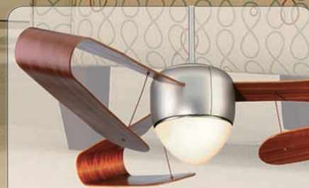
THE CENTAURUS SN #FP4220SN mit Flügel #BB4220MH, Mahagoni gebogen (Ø 152 cm)