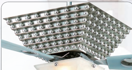
THE VETRICCO #FP3120SN Gehäuse Nickel satiniert, mit unzähligen polierten Chromkugeln