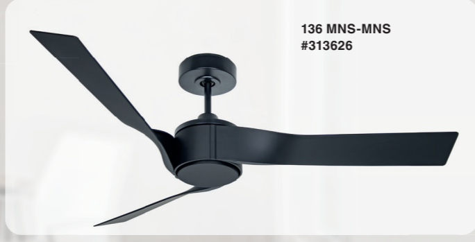
136 MNS-MNS #313626