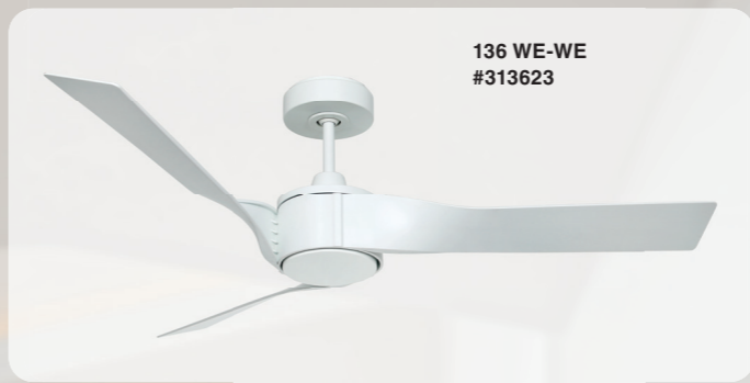
136 WE-WE #313623