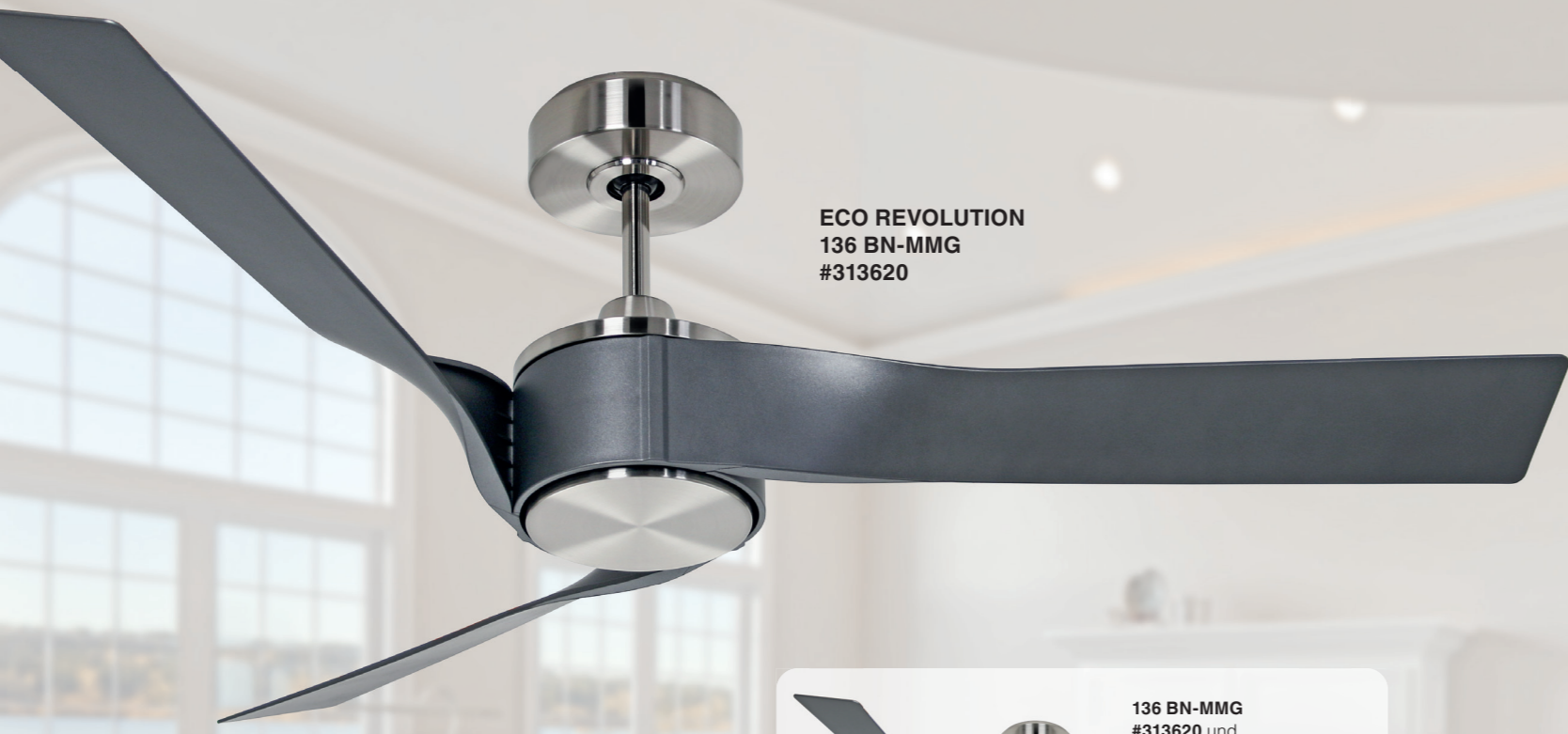
ECO REVOLUTION 136 BN-MMG #313620