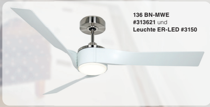
136 BN-MWE #313621 und Leuchte ER-LED #3150