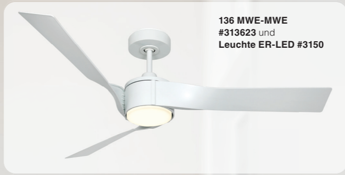
136 MWE-MWE #313623 und Leuchte ER-LED #3150