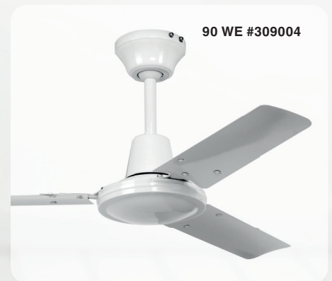
90 WE #309004