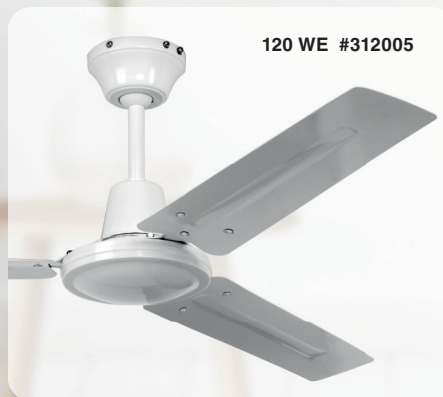
120 WE #312005