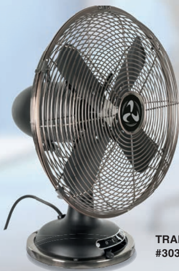
TRADITION TV 30 II MS #303053