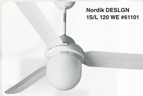
Nordik DESLGN 1S/L 120 WE #61101