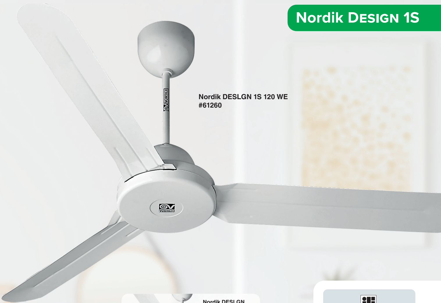
Nordik DESLGN 1S 120 WE #61260