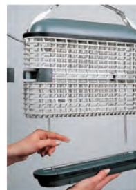
Versenkbarer Handgriff und patentierter Reinigungsauszug