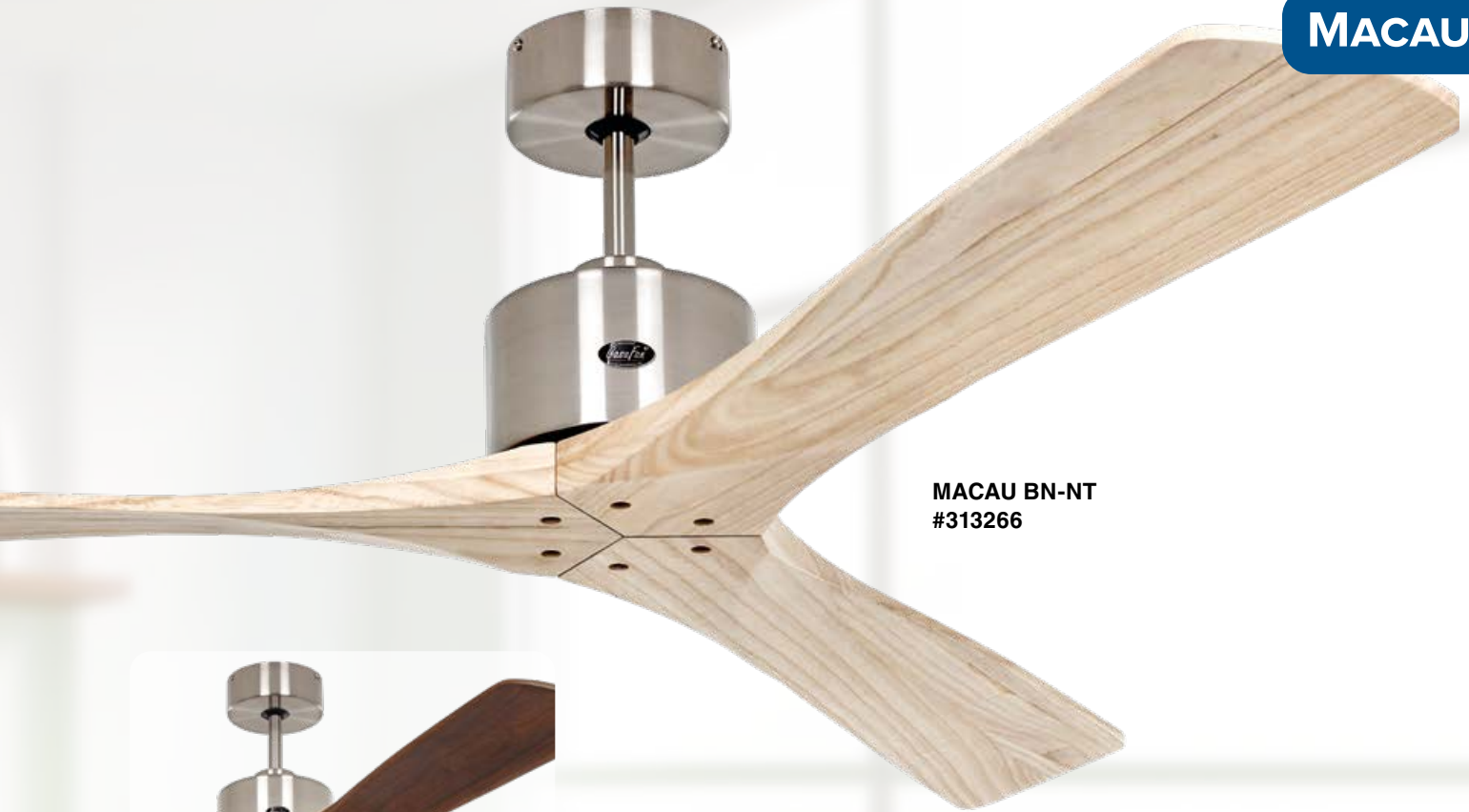
MACAU BN-NT #313266