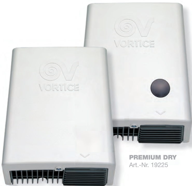
PREMIUM DRY Art.-Nr. 19225