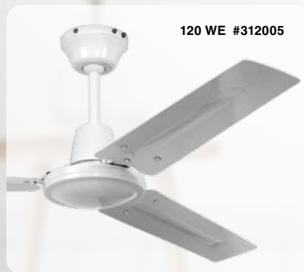
120 WE #312005