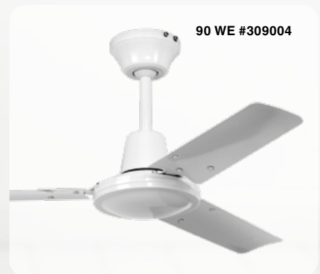
90 WE #309004